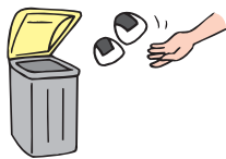
日本人1人ひとりがおにぎり2個分ずつの食べ物を毎日捨てていることになる

一方、日本では、まだ食べられるのに捨てられている食べ物の量は年間500万~900万トンもあり、食品が簡単に捨てられてしまう現状があります。