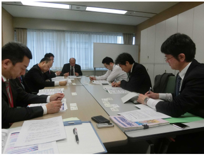
意見交換では営業担当者の生の声を伝えてきました。

その後の意見交換では、周知パンフレットの改善やアンケートの結果の改善に向けたさらなる指導強化等要望を伝えることができました。